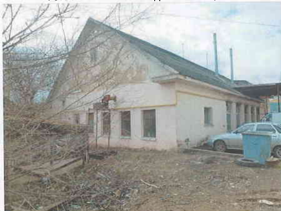
Фото № 2. Внешний вид объекта оценки