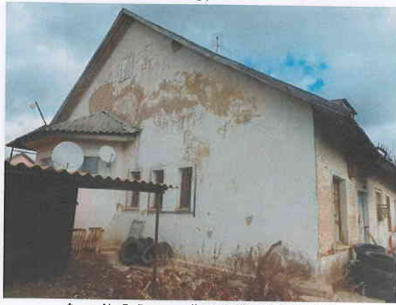
Фото № 5. Внешний вид объекта оценки