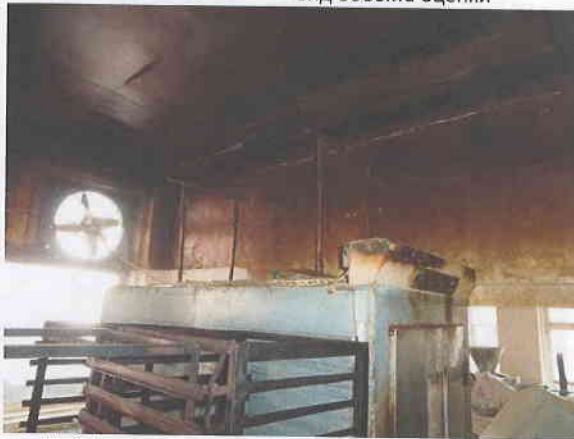
Фото № 6. Внутреннее состояние помещений объекта оценки