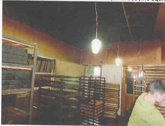
Фото № 7. Внутреннее состояние помещений объекта оценки