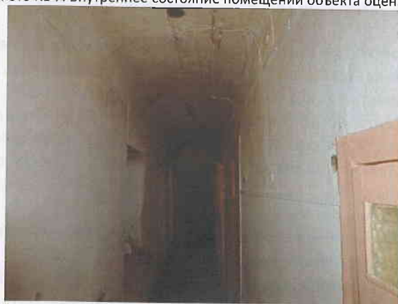
Фото № 8. Внутреннее состояние помещений объекта оценки