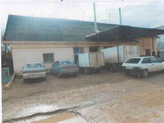
Фото № 1. Внешний вид объекта оценки